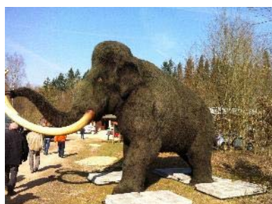
Pressekonferenz Dinosaurierpark Teufelsschlucht, Erzen