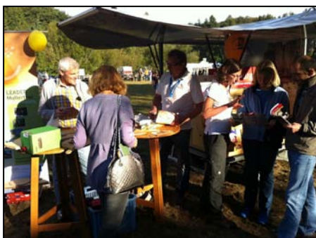
Landpartie vom SR3