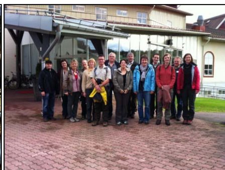
Waldseminar in Sunne