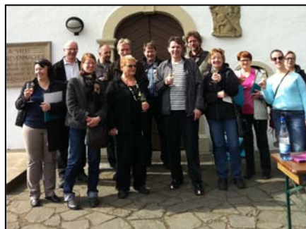
LAG „Outokaira tuottamhan ry“ aus Finnland