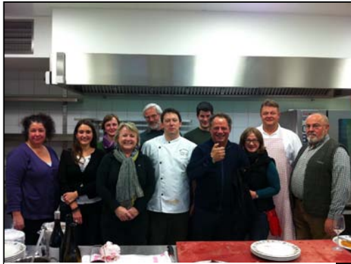
17.11.2012: „Kachen mat Wëld-Fleesch“

E-mail: leader@echternach.lu – Internet: www.mu.leader.lu