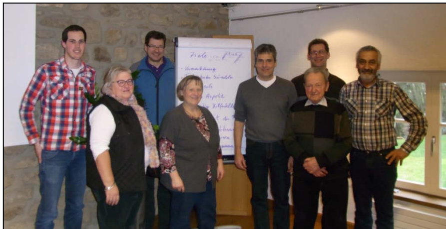
Seminar „Von der Produktion bis zur Vermarktung“