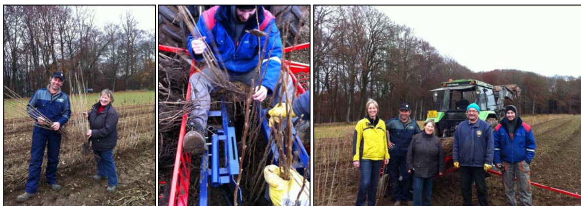
Pflanzung „Schwaarz Kréischelen“