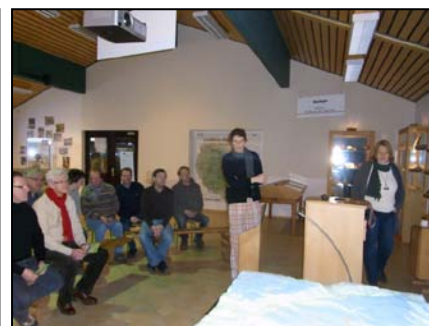
Naturparkzentrum Teufelsschl. und Ferschweiler Plateau