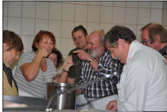
21.12.2012: „Kachcours mat Wëldfleisch“