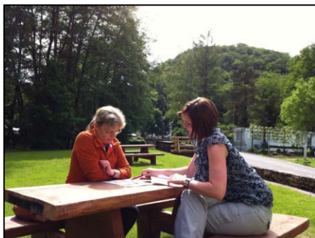
Arbeitstreffen Projektpartnern MU 4.2.1(c) N° 3