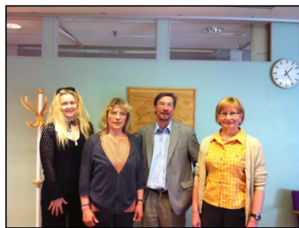
Treffen in Ikaalinen, Finnland