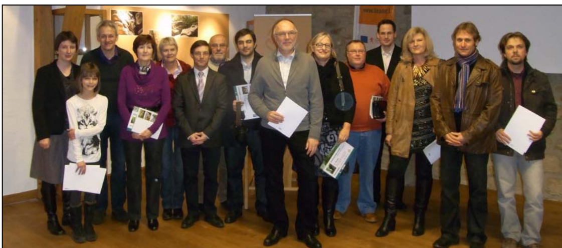
Preisverleihung der Gewinner des Fotowettbewerbs „Steinreich 2011“ in der Heringer Millen