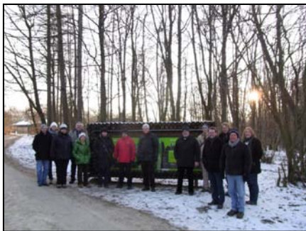
Naturparkzentrum Teufelsschl. und Ferschweiler Plateau