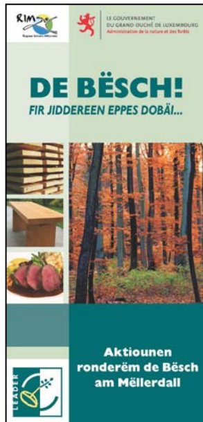
Flyer „De Bësch“