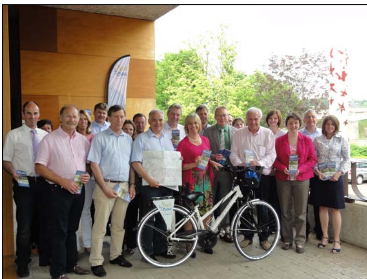
Offizielle Herausgabe der Karte „Grenzenlos Radeln entlang von Mosel, Saar und Sauer – 3 Länder, 9 Routen“