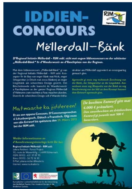
Plakat zum Ideenwettbewerb „Mëllerdall-Bänk“